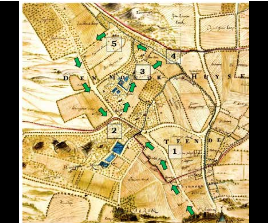
Kaart (deel) van het oostelijk Schependom van Arnhem getekend in 1643 door Nicolaes Van Geelkercken - de excursieroute is aangegeven met pijlen, de excursiepunten met zwarte cijfers.

Velperpoort en rechts daarvan de Janspoort. Daarachter de stad zelf met de vele kerken, gebouwen en huizen, dicht opeengepakt. Aan beide zijden van de weg strekt het open glooiende heuvelland van het schependom zich uit, met diep ingesneden beekdalen en daarboven een stralende Ruysdael-lucht. Voor ons in de verte ligt het donkere heitvelt. Wil je lezen hoe deze excursie verder verloopt en wat de groep allemaal meemaakt? Dat lees je op www.paasberg-wellenstein.nl .