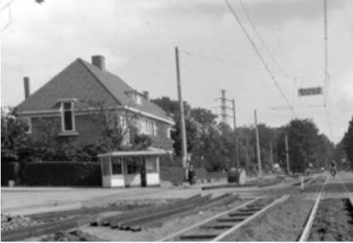
Afbeelding 1. Velperweg, hoek Vondellaan, 1934.

In 1934, niet lang nadat de eerste huizen in onze wijken werden opgeleverd, begon men met de her-