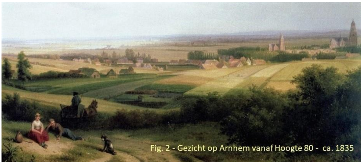
Fig. 2 - Gezicht op Arnhem vanaf Hoochte 80 - ca. 1835

Hier hebben we een adembenemend uitzicht over het hele omliggende gebied (Fig.2). Direct beneden ons ligt het lange komvormige dal van de Bonte Weteringh. In het noordoosten herkennen we de Ratstakenberg, die we vanochtend gepasseerd zijn. In noordelijke richting kijken we uit over de glooiende paarse heuvels van het Arnhemse heytsel , nu vol in bloei. In het westen zien we de hoge Galgenberg van het schependom Arnhem, aan de uitvalsweg naar Deventer. In het zuidwesten herkennen we de Angeresteinse Spijker met gracht, boomgaarden en papiermolen.